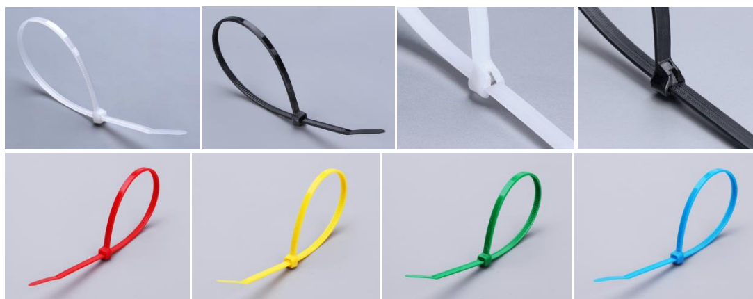
Рис.1 - Внешний вид стяжек КСС и КСЗ.

Стяжки кабельные повышенной прочности КСЗ отличаются от стандартных пластиковых стяжек КСС наличием стального зуба в замке и отсутствием пазов на ленте, что обеспечивает плавную бесступенчатую фиксацию в любой точке ленты, увеличивает площадь поперечного сечения и повышает допустимую рабочую нагрузку. Уникальная конструкция замка стяжек КСЗ с плавным переходом от головки к ленте усиливает зону, особо подверженную разрыву. Материал зуба – сталь марки AISI 304.